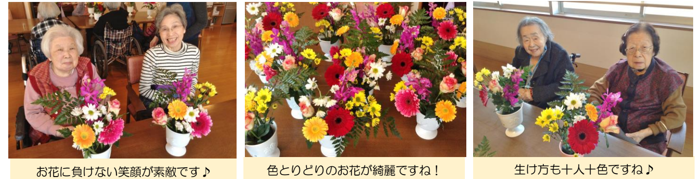
お花に負けない笑顔が素敵です♪