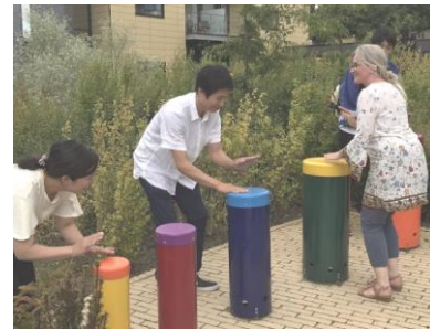
デンマーク研修の様子

資格（介護職員初任者研修・介護職員実務者研修）の取得支援講義も法人内で行います。