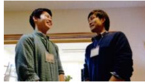
お兄さん役の先輩職員（右）

「エルダー」と呼ばれるお姉さん、お兄さん役の先輩職員がついて一年間成長を見守っていきます。日常生活の相談、仕事の悩み、仲間意識が持てる相手として存在します。新人職員だけでなく、エルダー役の先輩職員が共に成長していく為の教育ツールです。