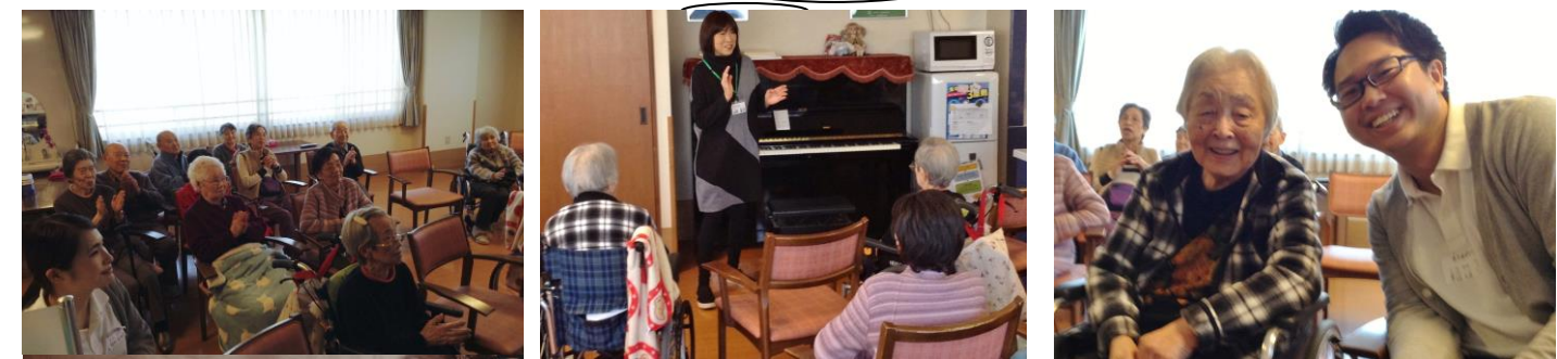
手拍子で盛り上げていますね！