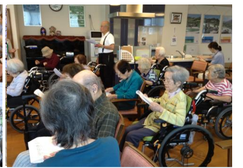
歌詞カードを見ながら一緒に唄います。