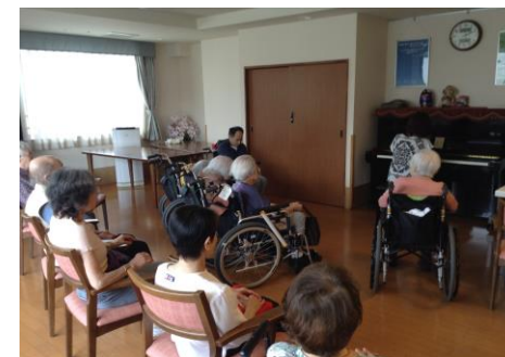
クラシックピアノの音色に聴き惚れ、...