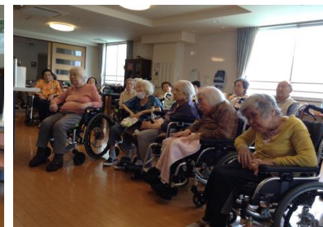
ポップスや映画音楽・・・