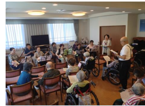
花笠踊り、ソーラン節、草津節