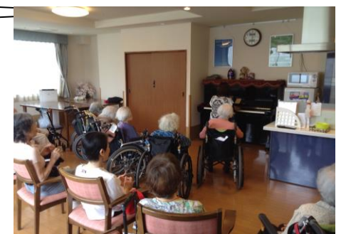
童謡や季節の歌は、皆さんと一緒に♪