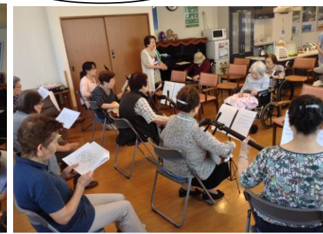
炭坑節、東京音頭、天竜下れば♪