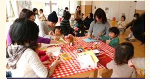
好きなものを制作して遊ぶ親子