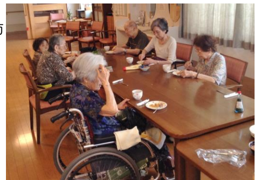
焼き立てのお好み焼きを頂きます