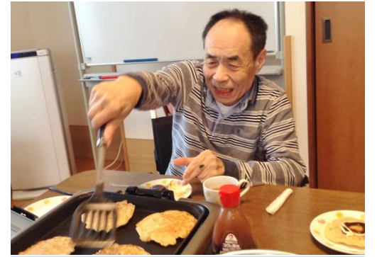
フライ返しでひっくり返してよく焼きます

ご自分で焼いて召し上がる方や他のご利用者のために焼いて下さる方もいて、大変盛り上がりました。手作りのおやつは毎回楽しみです。