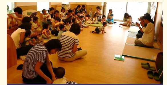
お話会に参加している小規模保育園児

小規模保育園、家庭福祉員(保育ママ)との交流会を行うことで、園庭やホール等の遊び場を提供し、子どもたちの親睦を深めています。