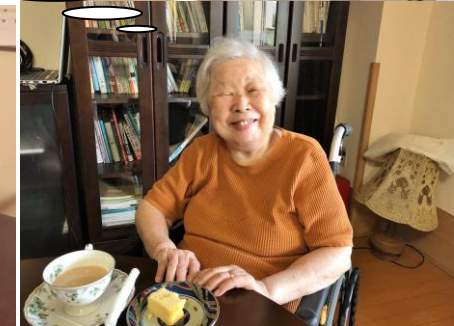
素敵な笑顔もたくさん頂きました！