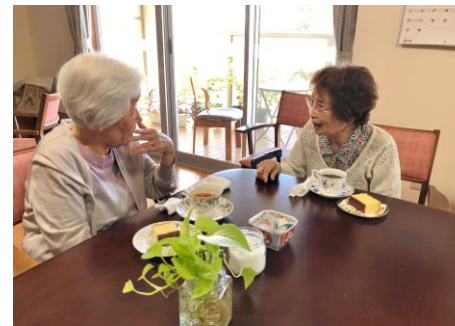
ご入居者の皆さんの交流が多く