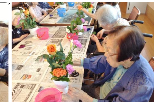
綺麗な生け花が出来ました♪