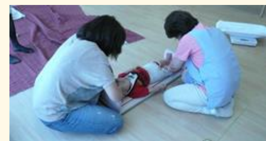
看護師が身長を測定する

月に1回程度定期的に、身長・体重の測定を行い、看護師が健康面の指導を行っています。