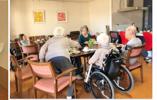
他の方を手伝って下さいます♪