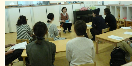
講座「栄養士による離乳食」

保育に関するテーマについて講座を開き、園長、保育士、栄養士、看護師等が講師になり、それぞれの専門性を活かして支援します。