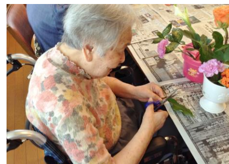
お花の切り方、生け方を教えてもらい