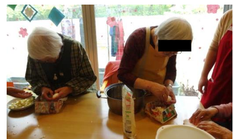
手際よく玉子の殻をむく

地域の方々とのコミュニケーションをとりながらの共同作業はとても刺激があり、みなさん笑顔で料理に取り組んでいます。また、地域の方々が、外で会ったご利用者に声をかけてくださいます。