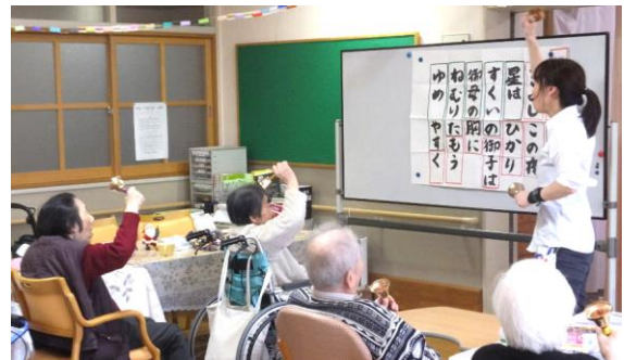
ハンドベルで奏でながら歌います

皆さんと楽しみながら歌に合わせて体操したり、季節を感じたり、様々な楽器を奏でたりしています。