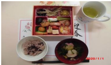
元旦のおせち料理