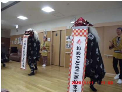
「獅子舞」でお正月を満喫！ありがとうございました。