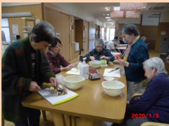
コーヒーの香りは最高