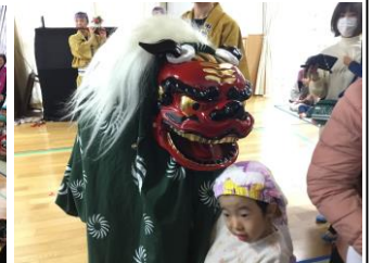
近隣保育園の子どもたちや地域の方々にもお越しいただきました