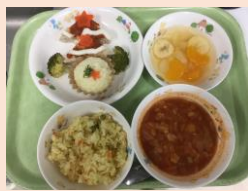
クリスマススペシャルメニュー ・ツリー型のハンバーグ ・マカロニ入りミネストローネ