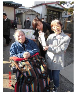
初詣に行きました。おみくじはもちろん大吉！良い年になりますように...