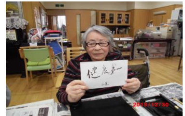
書初めにそれぞれの思いを込めて書き上げました...