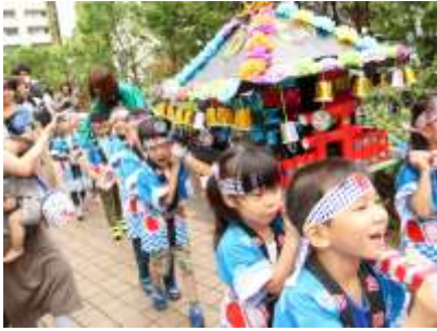
自分たちで作ったお神輿を担ぎ、順天堂を練り歩き (5歳)

各コーナーからは、子どもたちの楽しそうな笑い声が聞こえ、大盛況のうちに終了しました。お暑い中ご参加頂き有難うございました。