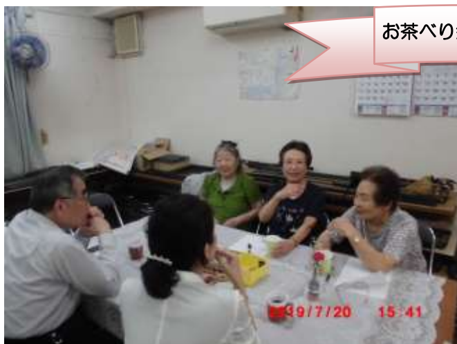
お茶べり会の様子