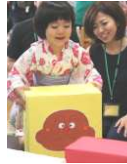
ツムツムゲーム (上)