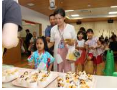
2階ホールでは「焼きそば」「新砂パフェ」を屋台形式で提供しました。