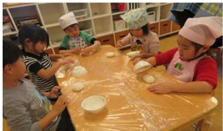
炊き立てのご飯をおにぎりにする