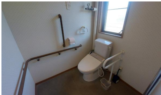
〈トイレウォシュレットリモコン撤去〉