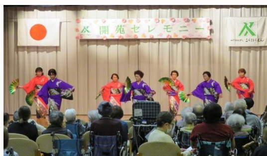
4月1日に(水)開催した「開苑セレモニー」の様