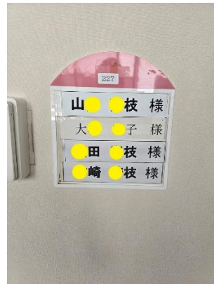
<居室入居者名表示>