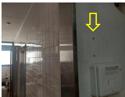
〈3階トイレ表示撤去〉

◎「2階吹き抜けの騒音軽減、空調効率化」については、1階のフロアを配置転換した関係で、音の問題は解消しました。