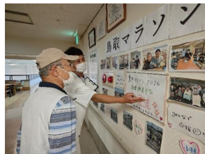
〈季節や行事の掲示物〉

入江委員： 鳥取マラソンは、「こうほうえん」として参加されましたか。以前は砂丘一斉清掃にも参加されていましたが、大企業として会社のアピールにもなりそうですが。