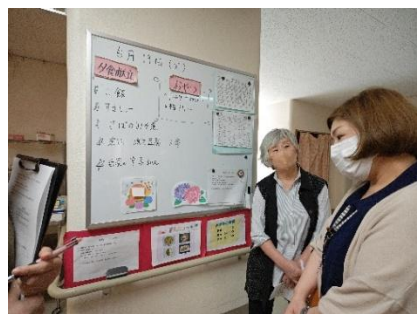
〈ホワイトボード見直し〉