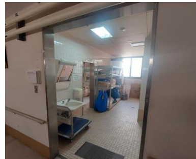
〈2階中央物置（元トイレ）〉