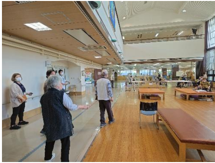
<1階レイアウト変更> (上は老健2階吹き抜け)